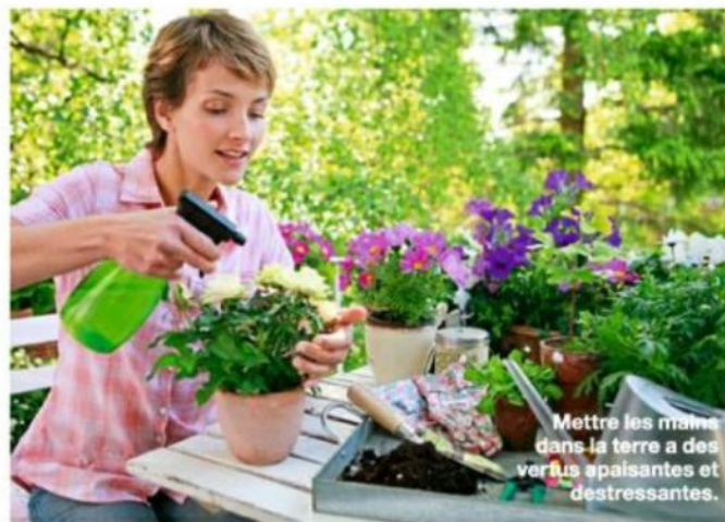
Mettre les mains dans la terre a des vertus apaisantes et destressantes.